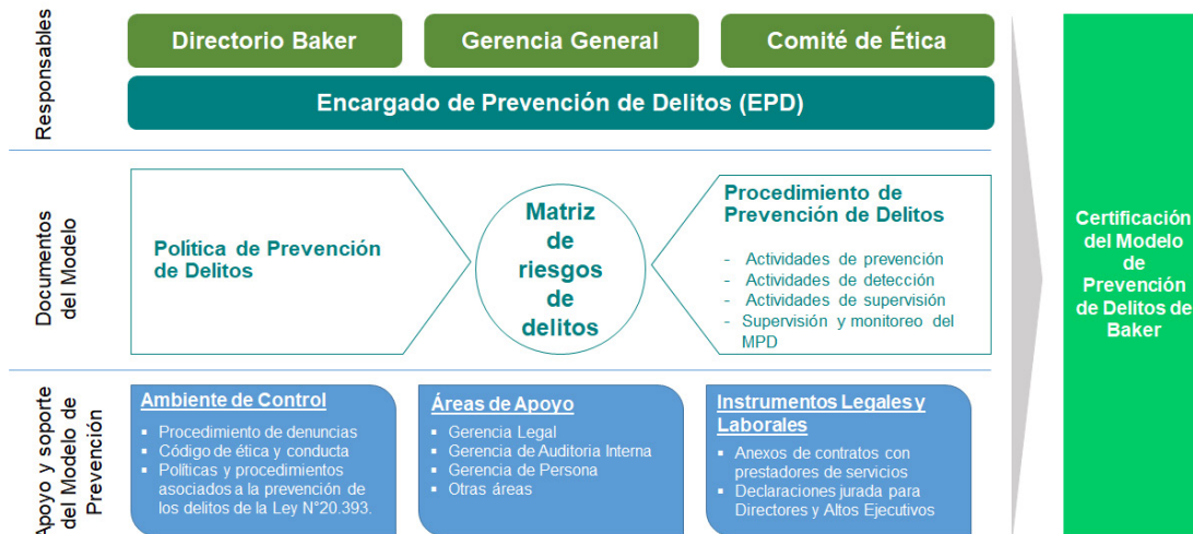
Figura 1: Representación gráfica de los componentes y áreas participantes del modelo.